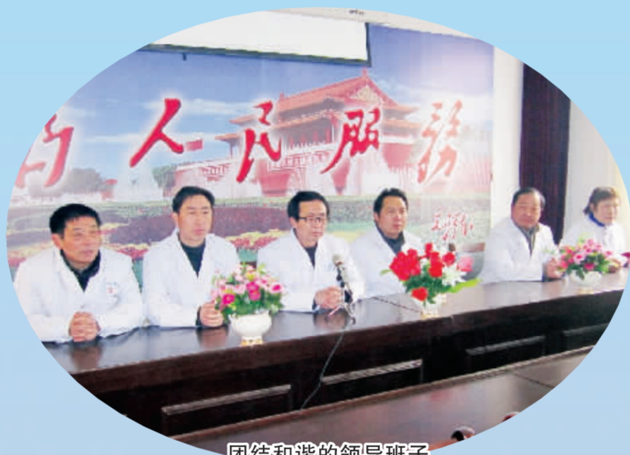
团结和谐的领导班子