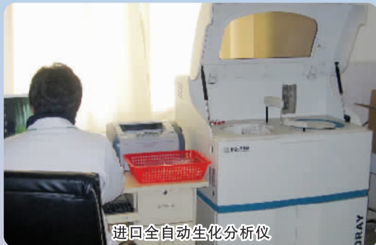
进口全自动生化分析仪