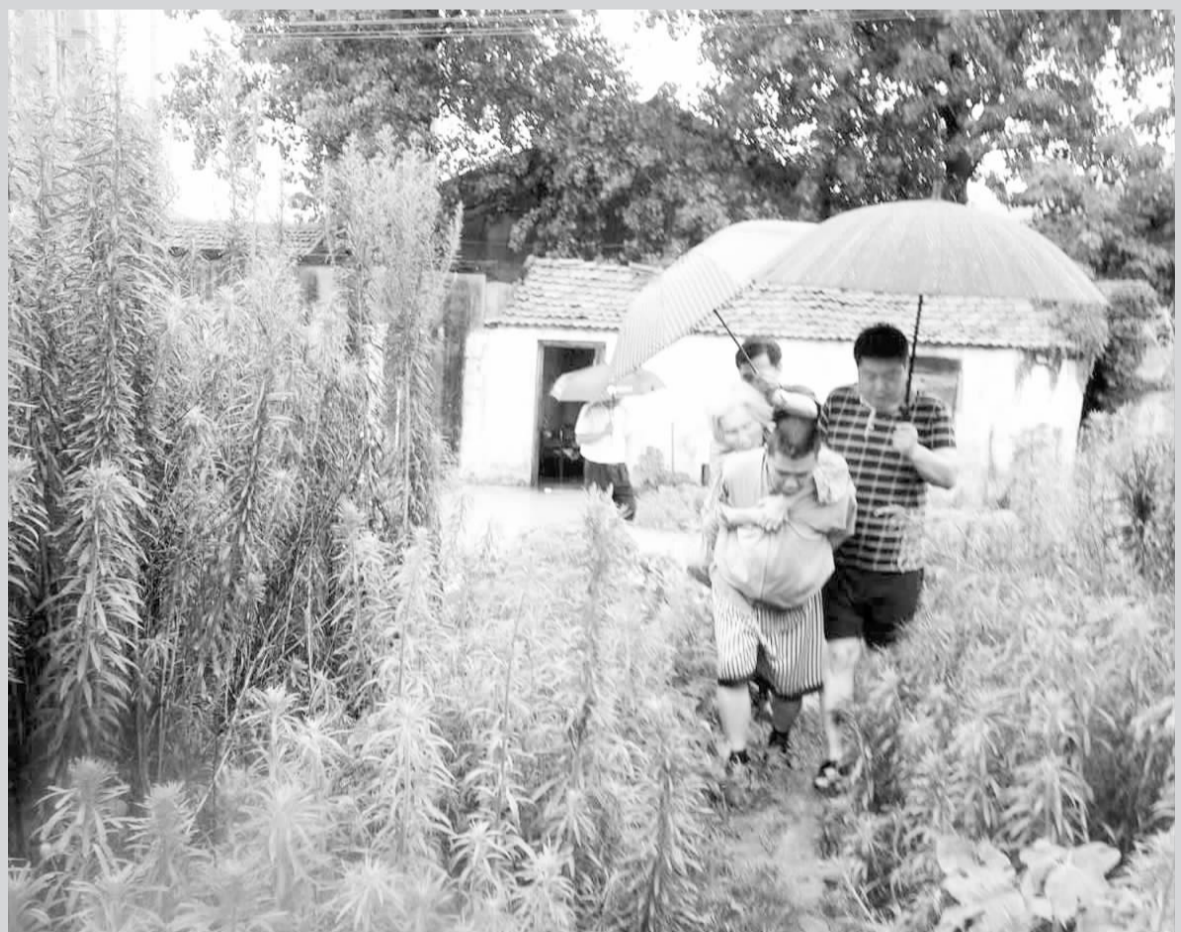
7月8日,多年不遇的暴风雨给人民群众生产生活带来了困难和损失。连日来,宿豫区豫新街道社区干部不畏狂风暴雨,始终坚持雨中指挥、水中排险,充分展示党员干部关键时刻冲在一线排涝抢险风采,深情体现党员干部为民情怀!图为雨露社区干部在低洼平房中排查险情,转移独居老人。