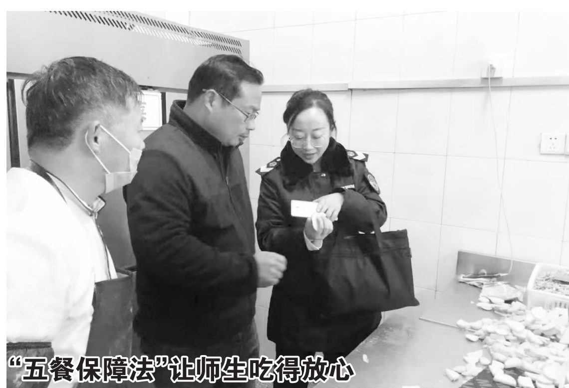
“五餐保障法”让师生吃得放心 宿城区市场监管局积极探索并在全省率先提倡和推行学校食堂“师生同餐、营养配餐、领导尝餐、明厨亮餐、留样备餐”的“五餐保障法”。经过前期推广,“五餐保障法”已得到学校的自觉遵守,并获省市食品安全监管机构好评。下一步,区市场监管局将把集中整治与日常监管、学校自律与强化监管相结合,把食堂食品安全摆在更加突出的位置,全面提高学校食堂管理水平和质量。

本报讯 今年以来,宿城区蔡集镇始终坚持把人才工作作为一项重点工作来抓,不断加大人才引用力度,着力开发人才资源,全面促进各类人才为经济建设服务,为蔡集镇的发展提供人才保障。 蔡集镇成立了人才工作领导小组,研究制定了《蔡集镇人才招引工作方案》,完善人才激励政策,定期召开党委会,研究听取人才工作汇报。同时,蔡集镇通过政策引才、外出招才、就地引人等方式,不断拓宽人才引进的渠道。此外,加强与村居外出人才的沟通,制定党委班子成员联系制度,最大程度争取人才的回归。 人才培育典型带动最有影响力。蔡集镇广泛开展宣传,大力宣传人才政策,寻找树立先进典型。对已引入的人才建立人才档案,对下一步的培养及发展进行跟踪,便于更好地发挥人才优势。同时加强人才工作调研,总结经验,发现问题加强指导,在全镇营造“尊重人才、尊重创造”的良好社会环境。 难事,难题,第一时间发现,第一时间解决。蔡集镇搭建服务平台,定期开展座谈会,每季度召开创业人才、教师人才、退休干部等人才座谈会,了解人才的工作诉求,及时向领导反馈,争取第一时间给予解决。同时,镇财政拨出专门经费,用于人才的引进和培养,重点对为该镇经济建设做出杰出贡献的创业人才进行奖励。 (刘静)