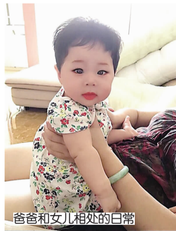
爸爸和女儿相处的日常