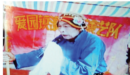
▲“浪夕阳演艺团”演出场景(视频截图)