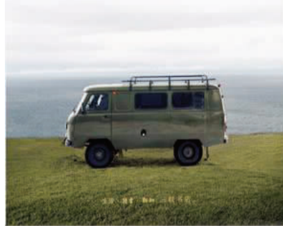
书名：《蒙古国纪行》 作者：罗丰

内容简介：2006年夏的蒙古国考察，是一次以中国学者为主、多国多学科人员共同参与的蒙古历史考察之旅，历时14天，行程2800公里。考古学者罗丰以详实丰赡的旅行笔记为基础写成此书，生动记述了一行人的甘苦和收获。一路上作者笔不离手，不放过点滴的个人感受和生活细节，他追摩前辈科学探险学者的风范，悉心记录游牧生活特有的风土人情，壮丽苍茫的草原美景，以及先民留下来的鹿石、碑铭、遗址、墓葬等，配合大量照片、手绘图片，使这部纪行成为一部难得的科考笔记佳作。