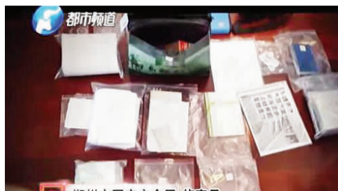
郑州市国家安全局 侦察员 在工作中接触到的一些涉密资料 不能私自保留的他私自带回家中 以备将来出境 提供给对方