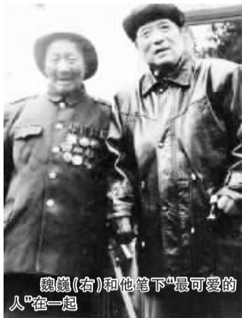
魏巍(右)和他笔下“最可爱的人”在一起